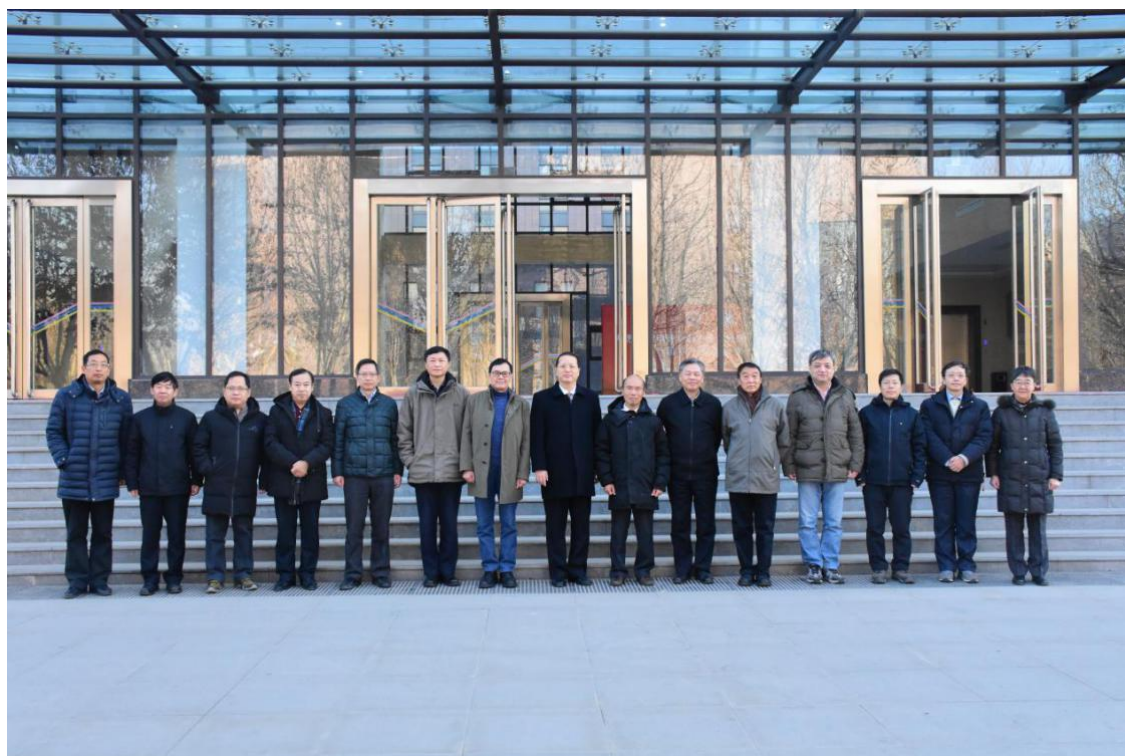
甲骨文信息处理教育部重点实验室第一届学术委员会合影

实验室结合国家重大战略、立足地方经济建设发展特点和优势，研究特色鲜明、优势明显，并针对实验室研究方向的进一步凝练、实验室资源的进一步整合等方面提出了意见和建议。