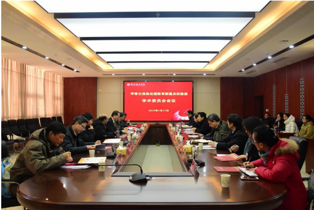
学术委员会会议现场