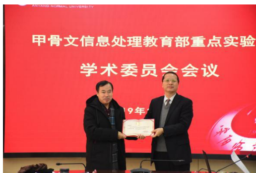
学术委员会委员宫长为