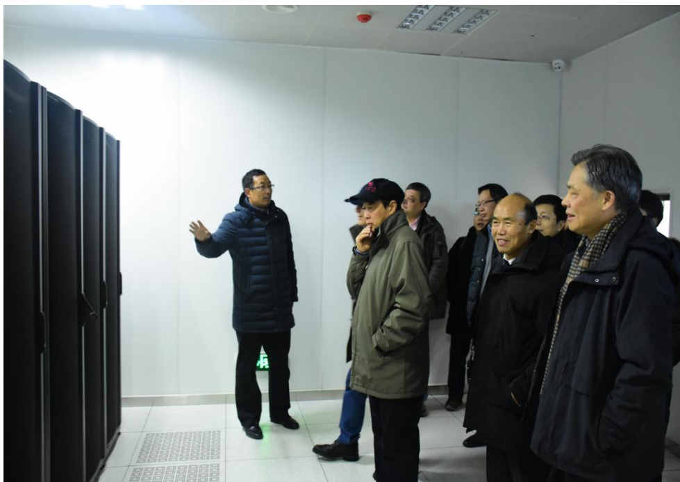
参观甲骨文数据中心